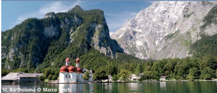
St. Bartholomä

Der zwischen steilen Berghängen eingebettete, langgestreckte Königssee im Berchtesgadener Land zählt zu den schönsten Alpenseen. Viel besungen ist das barocke Wallfahrtskirchlein St. Bartholomä auf der Halbinsel Hirschau.