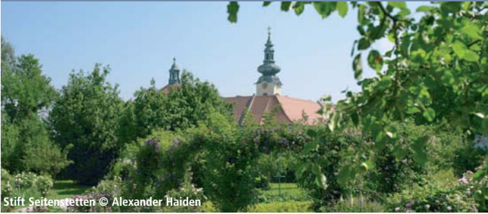
Stift Seitenstetten

Das Stift Seitenstetten feiert heuer 900 Jahre seiner Gründung. Gemeinsam mit dem Sumerauerhof gibt es eine interessante Ausstellung über „Leben im Vierkanter“. Außerdem findet der Herbst-Pflanzenmarkt statt!