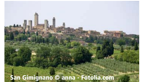
San Gimignano