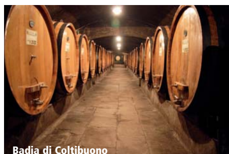
Badia di Coltibuono

Das Hotel liegt inmitten eines Parks auf einem Hügel oberhalb von Radda in Chianti. Das Haus ist eine gelungene, geschmackvolle Kombination aus toskanischem Stil mit modernem Design. Vom Restaurant aus haben Sie einen schönen Panoramablick auf die Weinlandschaft.