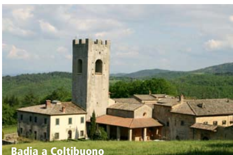
Badia a Coltibuono

Fahrt über Poggibonsi nach San Gimignano. Hier findet sich noch ein besonderes Beispiel mittelalterlicher Stadtkultur, die so genannten „Geschlechtertürme“. In der heute noch von einer Mauer umgebenen Stadt sind Piazza della Cisterna, Piazza Duomo und die romanische Kollegiatskirche. Weiterfahrt nach Volterra. Auch hier finden Sie sich in das Mittelalter zurück versetzt. Auf der Via Panoramica spazieren