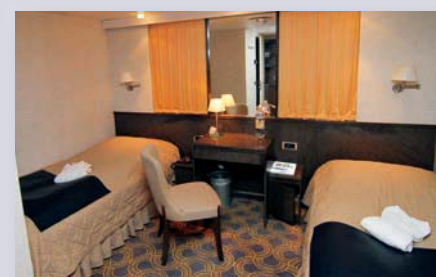
Innenkabine, Kat. 2