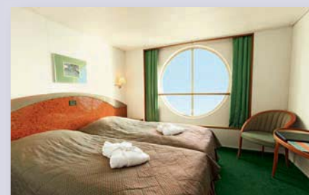
Außenkabine, Kat. 7