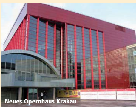
Neues Opernhaus Krakau

2. Tag: Nach dem Frühstück erkunden wir die Krakauer Altstadt und das ehemalige jüdische Viertel: Hauptmarkt mit seinen historischen Gebäuden, einer der größten seiner Art in Europa, Rathauerturm, Tuchhallen mit den neugotischen