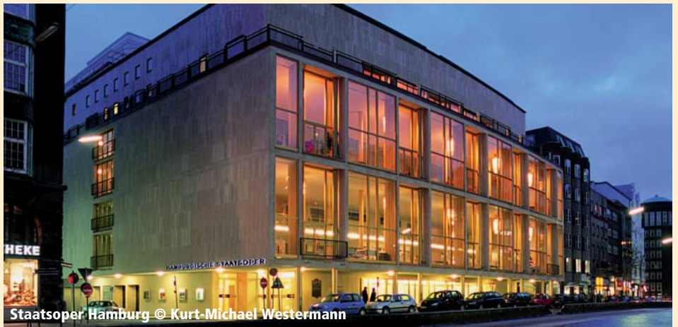
Staatsoper Hamburg