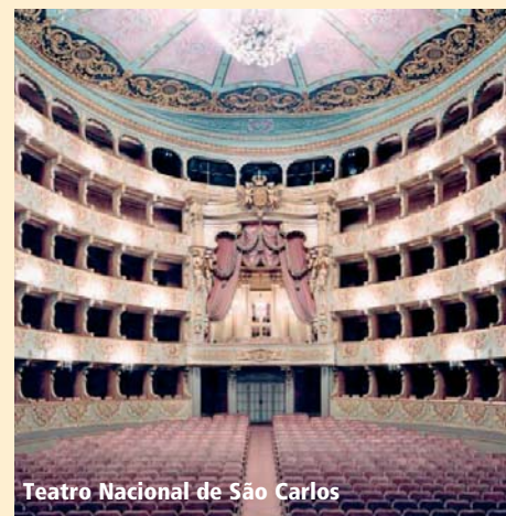
Teatro Nacional de São Carlos

4. Tag: Ein weiterer Ausflug führt uns zunächst nach Sintra, der Sommerresidenz der portugiesischen Könige. Nach kurzer Fahrt erreichen wir Cabo da Roca, den westlichsten Punkt des europäischen Kontinents. Einige Kilometer südlich liegt der hübsche Küstenort Cascais. Hier befindet sich die bekannte „Boca do Inferno“, ein vom Meer ausgehöhlter, fast 20 Meter tiefer Klippenkessel, an dem tosende Gischt hochbraust. Ein besonderes