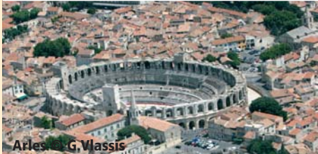
Arles