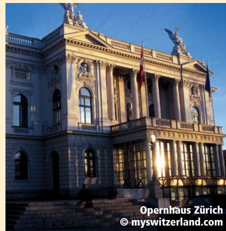
Opernhaus Zürich