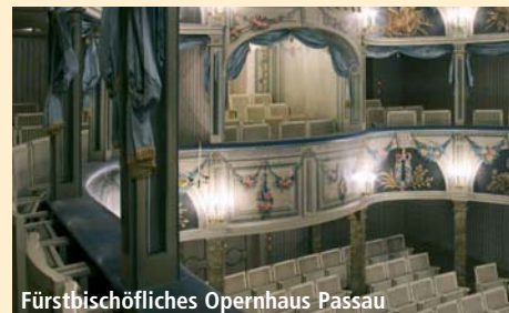
Fürstbischöfliches Opernhaus Passau

Unsere Musikreisen-Stammkunden wissen es seit Jahren: Das kleine, entzückende Opernhaus Passau ist immer eine Reise wert! Das Haus ist ein wahres Juwel klassizistischer Theaterarchitektur und der dort herrschende Ensemblegeist führt immer wieder (auch ohne Weltstars) zu Aufführungen von beeindruckender künstlerischer Dichte.