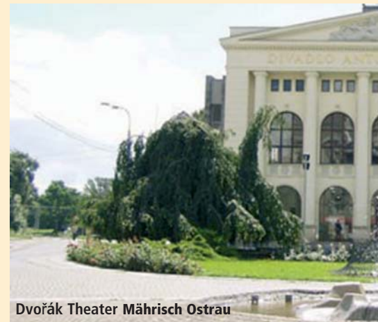
Dvořák Theater Mährisch Ostrau