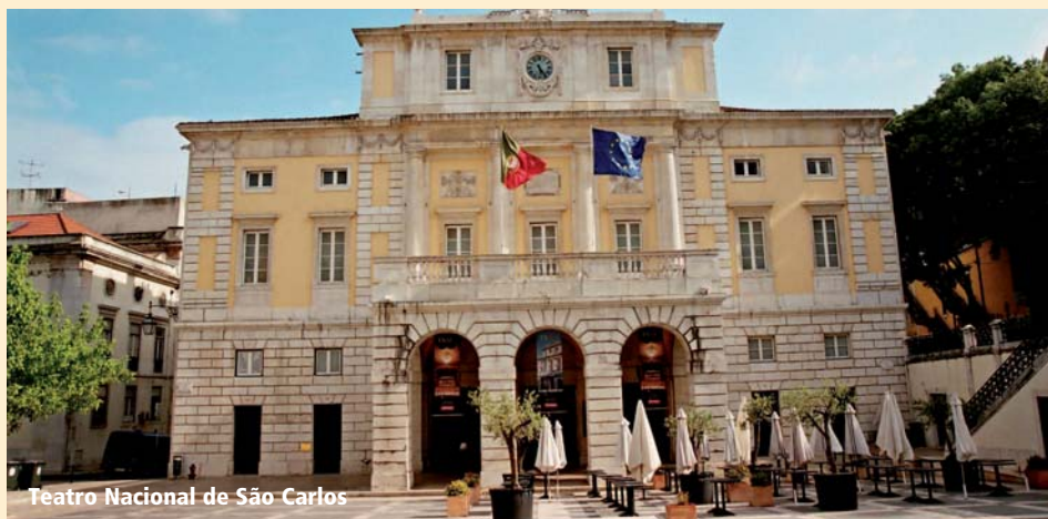
Teatro Nacional de São Carlos

Teatro Nacional de São Carlos: O BASCULHO DE CHAMINÉ (M.A. Portugal) MADAMA BUTTERFLY (G. Puccini)