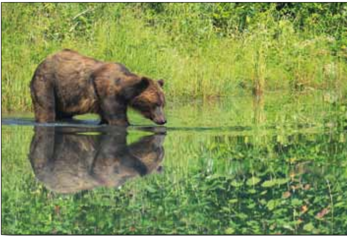
Grizzly am Fish Creek/Hyder, Alaska