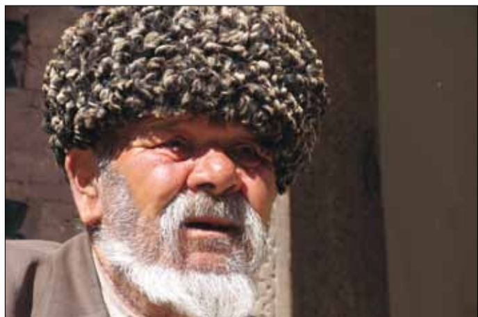
Mann aus Chiwa

4. Tag: Chiwa - Buchara. Frühmorgens brechen wir auf und fol-