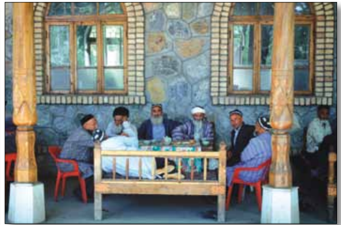
Teehaus in Samarkand