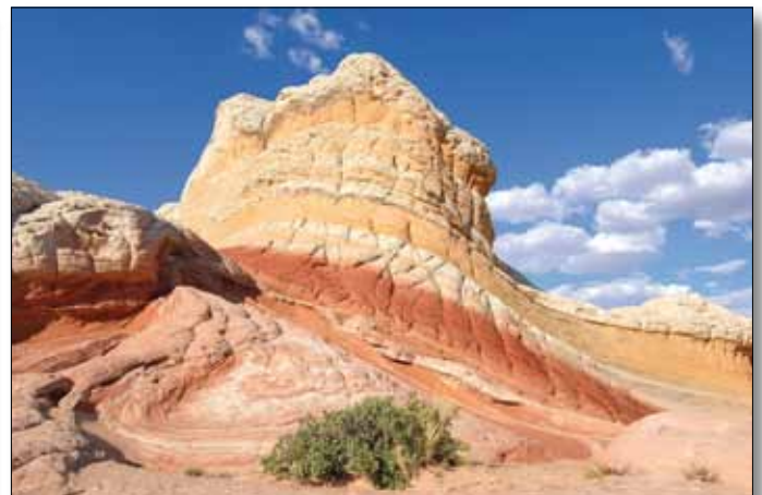
White Pocket/Pink Cliffs Vermillion National Monument