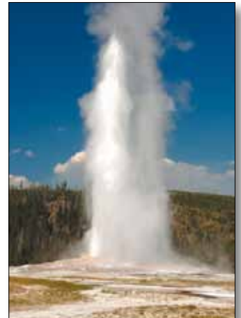
Old Faithful Geysir

5. Tag: Jackson - Salt Lake City. Am Morgen Fahrt Richtung Süden durch Wyoming nach Salt Lake City, Hauptstadt des Bundesstaats Utah und Zentrum der Religionsgemeinschaft der Mormonen. Zentrum ist der Tempelbezirk, wobei der Tempel selbst für Nicht-Mormonen verschlossen ist; Besucher werden im Tabernakel, einer der weltgrößten Kuppelbauten mit freitragendem Dach, willkommen heißen. Mit etwas Glück kann man die fantastische Akustik der Halle erleben, wenn ein Orgelkonzert gegeben wird oder der weltberühmte Mormon Tabernacle Choir probt. Neben dem Tempelbezirk lohnt sich ein Besuch des State Capitol, nach dem Weißen Haus in Washington D.C. das zweitgrößte Kapitol der USA.