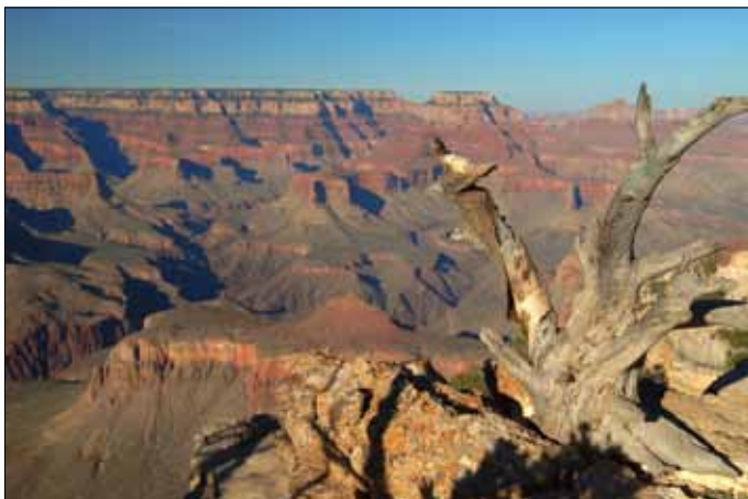
Grand Canyon Nationalpark, Südrand