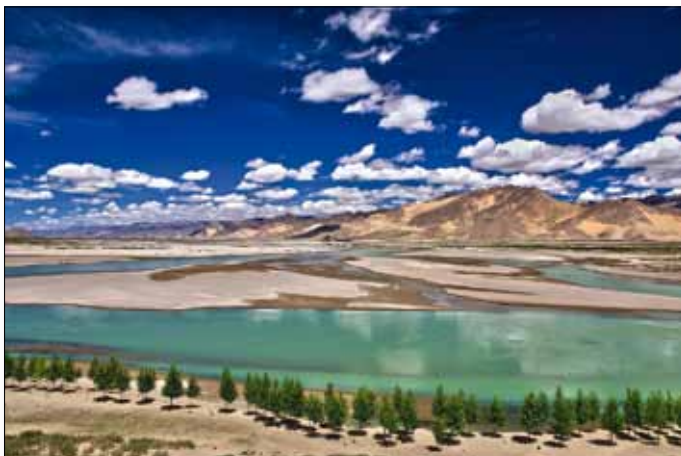
Brahmaputra bei Shigatse

12. Tag: Lhasa - Samye - Tsetang. Mit einem einfachen Kahn überqueren wir den Tsangpo, um zum Kloster Samye zu gelangen, das im 8. Jh. vom indischen Tantriker Padma Sambhava (dem 'Lotusgeborenen'), der den Buddhismus in Tibet lehrte, gegründet wurde. Der architektoni-