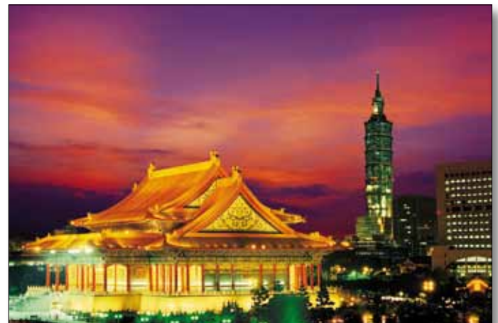
Taipei, Nationaltheater und Taipei 101-Tower