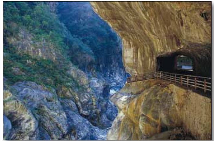
Wanderweg durch die Taroko-Schlucht