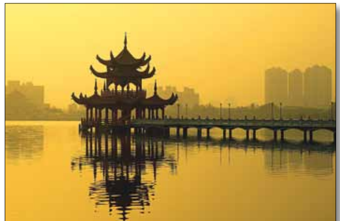
Kaohsiung, Lotos-See mit Pagode