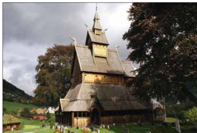
Stabkirche von Vik

15. Tag: Nordkap - Hammerfest - Alta. Entlang des Porsangenfjordes geht es heute zurück nach Skaidi und über die Kvalsundbrücke nach Hammerfest, die nördlichsten Stadt der Welt. Anschließend Weiterfahrt nach Alta, das am Altaelva, einem der besten Lachsflüsse der Welt, liegt. Alta ist die größte Stadt der Finnmark und gleichzeitig ihr kulturelles Zentrum. Besichtigung des Alta Museums mit seinen weltberühmten Felsritzungen, die von der UNESCO in die Liste des Weltkulturerbes aufgenommen wurden.