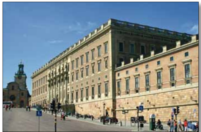
Stockholm, Königlicher Palast