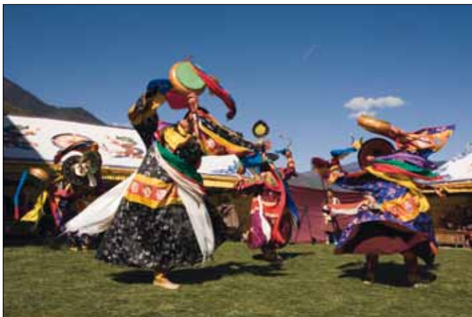
Zeremonie beim Klosterfest in Thimpu

15. Tag: Paro - Kathmandu - Swayambhunath. Transfer zum Flughafen und Flug nach Kathmandu. Das Kathmandu Tal im Herzen