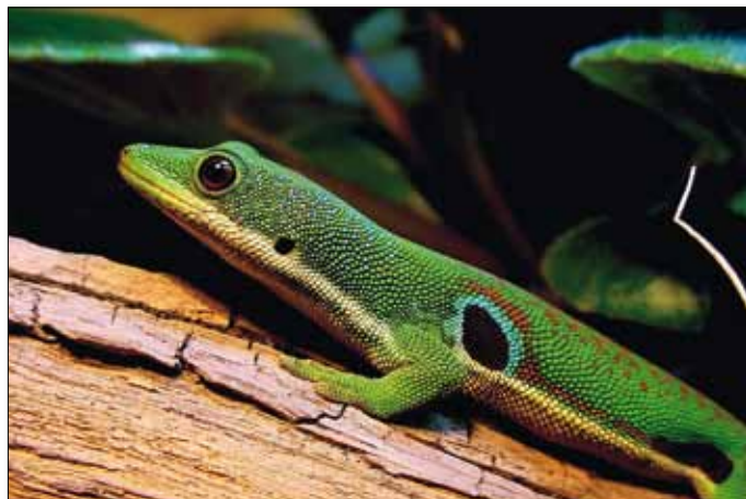
Gecko im Vallée de Mai