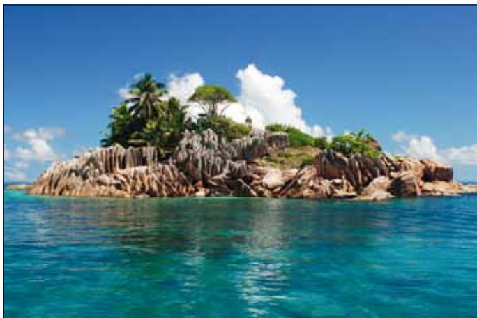
Insel St. Pierre

Mahe: **Hotel Sun Resort (nur wenige Schritte vom 3 km langen Sandstrand Beau Vallon sowie 10 Fahrminuten von Victoria)