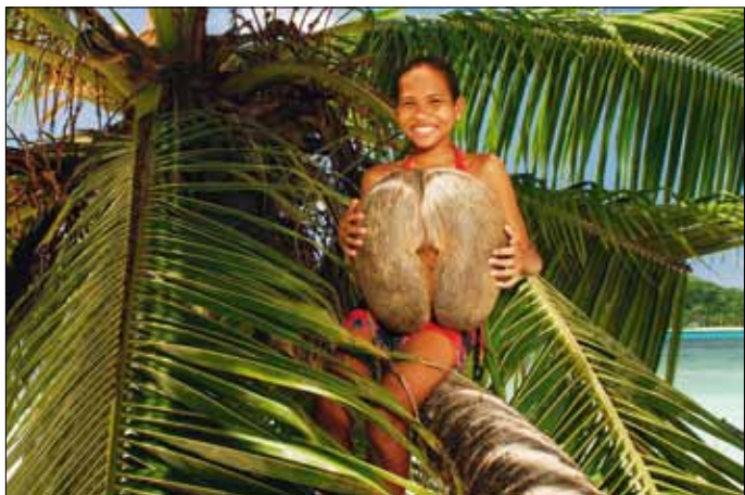
Coco de Mer