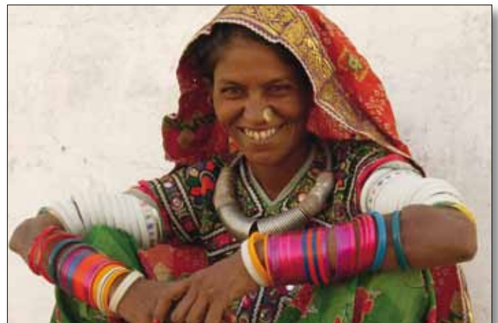
Besucherin am Pushkar-Fest

Hotelunterbringung: wie links, 'Indien - Rajasthan'