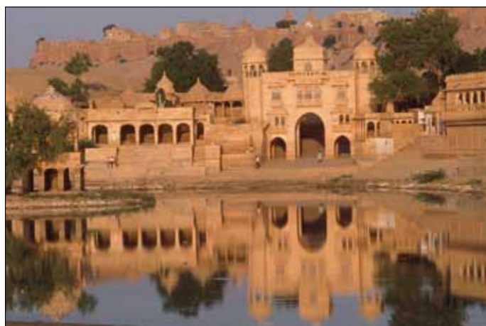
Jaisalmer, alte Ghats am Rande der Stadt

10. Tag: Jaipur - Fatehpur Sikri - Agra mit Taj Mahal. Durch das östliche Rajasthan geht es nach Fatehpur Sikri, die 'Stadt des Sieges' - die verlassene Residenzstadt des Mogulkaiser Akbars vermittelt mit gewaltigen Palastanlagen einen fantastischen Eindruck einer Mogul-