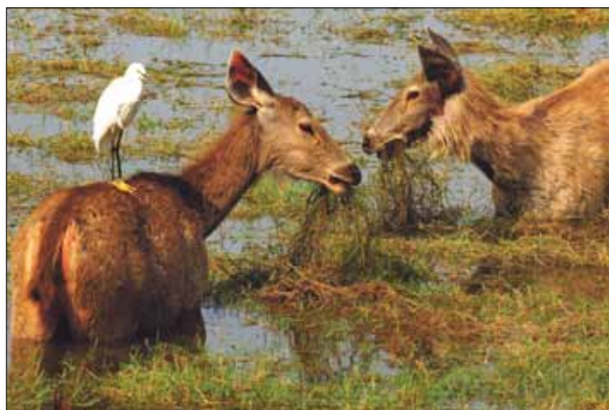
Sambarhirsche im Ranthambore Nationalpark

4. Tag: Beobachtungsfahrt in Bharatpur - Bahnfahrt nach Sawai Madhopur - Wildbeobachtungsfahrt im Ranthambore-Nationalpark. Am Morgen unternehmen wir eine Wildbeobachtungsfahrt mit Fahrrad-Rikshaws im Bharatpur-Vogelschutzgebiet, einst fürstliches Enten-Jagdgebiet. Auf 52 qkm Marschland leben Zehntausende Störche, Reiher, Schlangenhalsvögel, Pelikane, etc. Gegen Mittag Bahnfahrt nach Sawai Madhopur - weiter mit Kleinbussen zum Ranthambore Fort, das inmitten des beeindruckenden Ranthambore-Nationalparks liegt, einst Jagdrevier der Maharajas von Jaipur am Kreuzungspunkt der Vindhya-Berge mit den Aravalli-Bergen. Der Nationalpark besteht aus steilem Felsterrain und niedrigem Dschungel, der von grünen Lichtungen