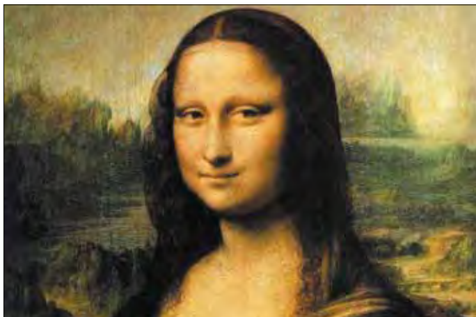
Paris, 'Mona Lisa' im Louvre

Eintritt 'Paradis à la Folie' inkl. 1 Glas Champagner € 60,--