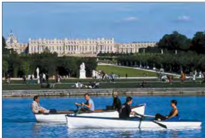
Schloss und Gärten von Versailles