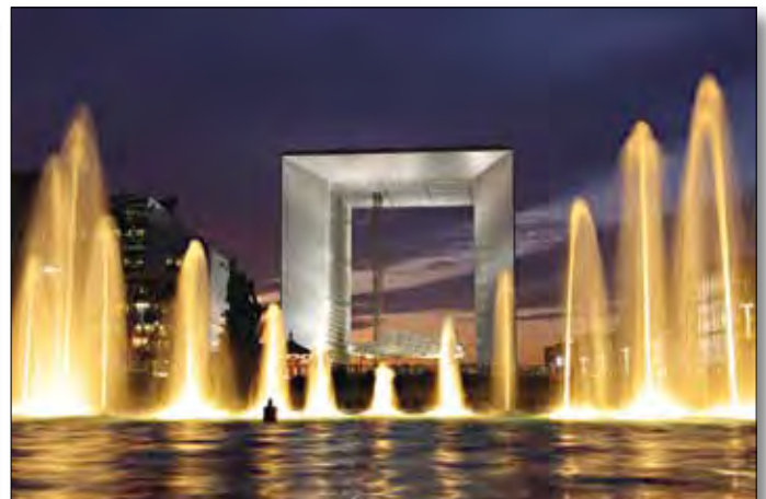
Paris, Grand Arche im Viertel La Défense