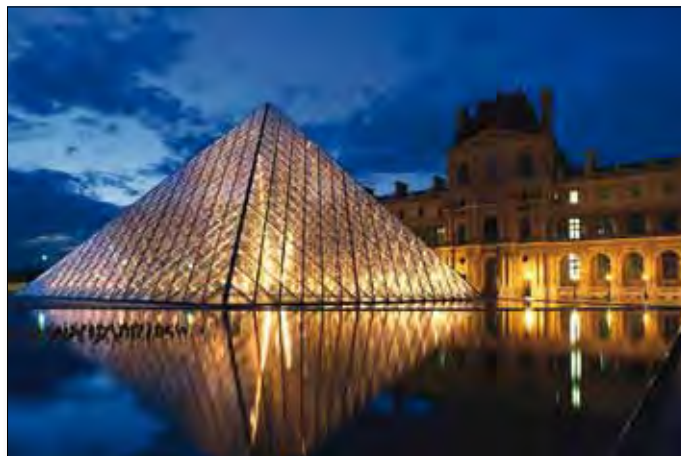
Paris, Louvre mit der Eingangspyramide