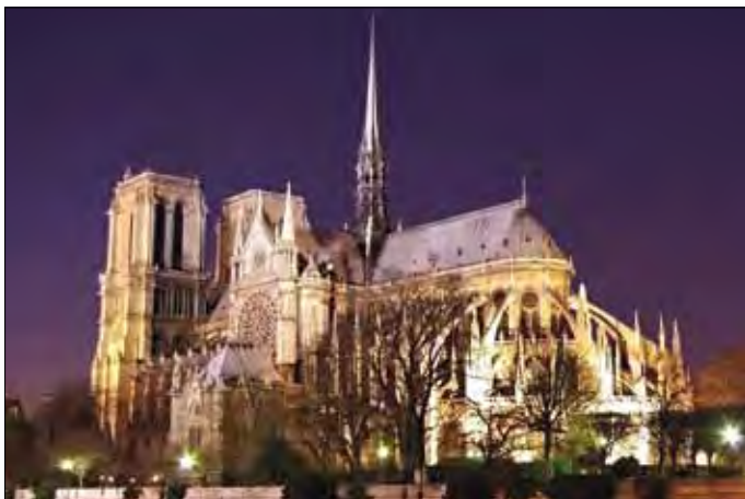
Paris, Kathedrale Notre Dame

Eintritt 'Paradis à la Folie' inkl. 1 Glas Champagner € 60,-