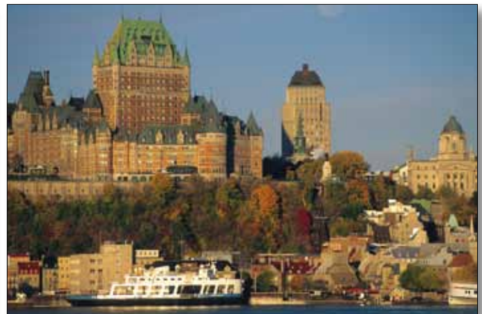
Quebec City mit dem Chateau Frontenac