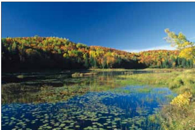
Indian Summer im La Mauricie Park

12. Tag: Sydney - Louisbourg - Halifax. Die Fahrt auf Cape-Bre-