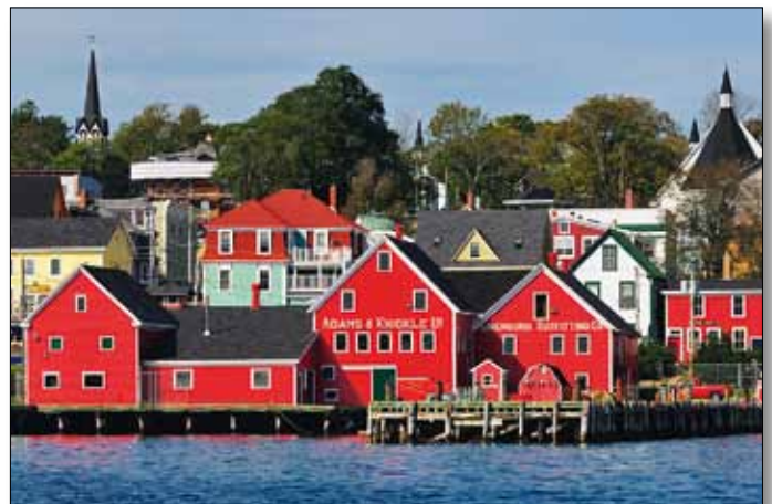
Lunenburg, Nova Scotia