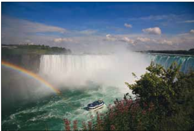
Niagara Falls, „Maid of the Mist“ Bootsausflug