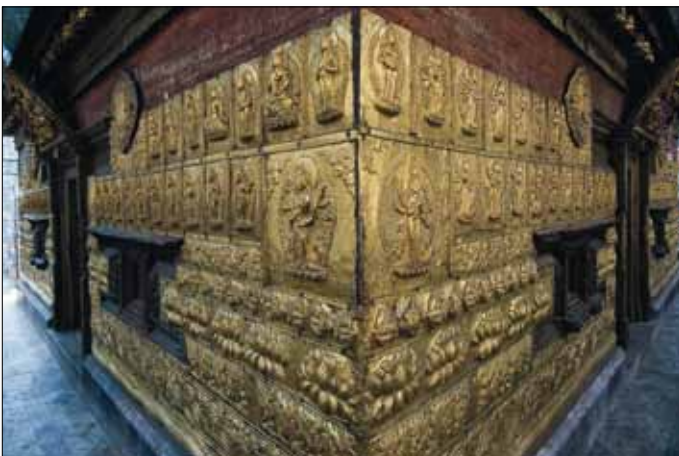
Goldener Tempel in Patan