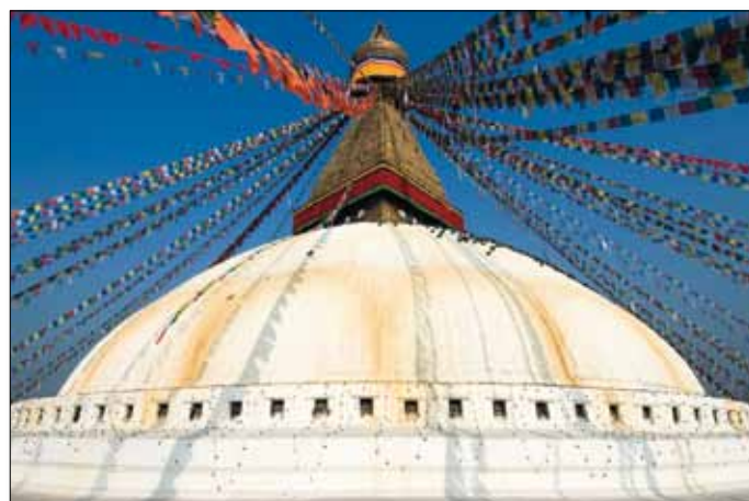
Stupa von Bodnath

5. Tag: Chitwan-Nationalpark. Den ganzen Tag verbringen wir im Nationalpark. Am frühen Morgen erwartet uns ein Ausritt auf Elefanten, um Panzernashörner beobachten zu können, gefolgt von einer Kanu-