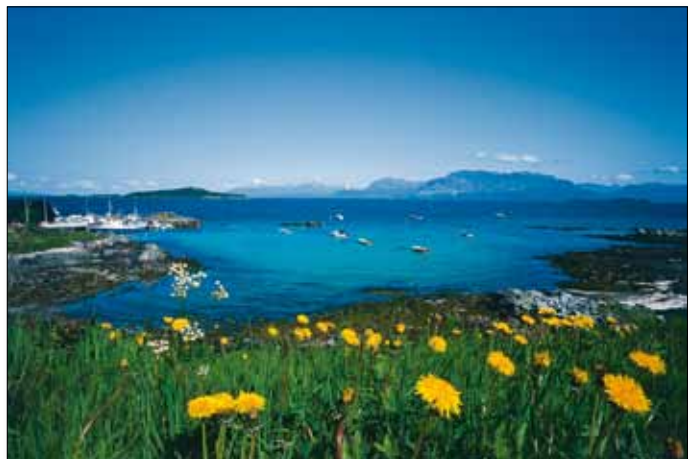
Fjordlandschaft in Nordnorwegen