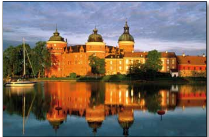
Mariefred, Schloss Gripsholm

6. Tag: Lidköping - Schloss Läckö - Marstrand - Göteborg.