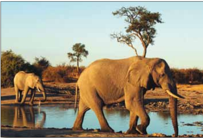
Elefantenherde an einem Wasserloch im Etoscha NP