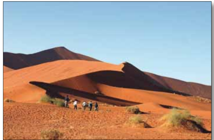
Düne auf dem Weg in das Sossusvlei

11. Tag: Etoscha Nationalpark. Den Tag verbringen wir im weltberühmten Etoscha Nationalpark, den 1907 der deutsche Gouverneur von Lindequist zum Schutzgebiet erklärte. Die weiß schimmernde Etoscha