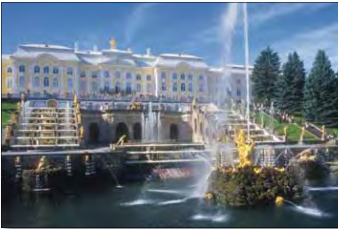
St. Petersburg, Peterhof