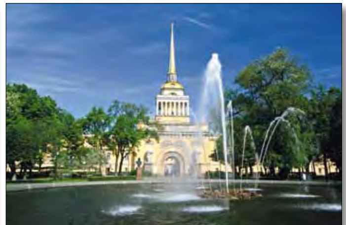
St. Petersburg, Admiralität

Hotelunterbringung: Die Unterbringung erfolgt in folgenden o.ä. Hotels (russische Klassifizierung), jeweils in Zimmern mit Dusche/WC: Moskau: ****Hotel 'Holiday Inn Sokolniki' (ca. 15 Min. vom Roten Platz) St. Petersburg: ***Hotel 'Dostojewsky' (ca. 10 Gehminuten vom Newski Prospekt)