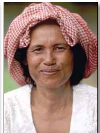
Frau aus Angkor