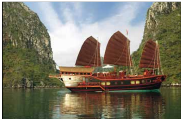
Ausflugsboot in der Halong Bucht

4. Tag: Hanoi - Hue: Perfume River Bootsfahrt. Am Vormittag Flug nach Hue, die ehemalige Hauptstadt der Nguyen-Dynastie, die bis zum Ende des 2. Weltkriegs an der Macht war. Die Stadt (UNESCO-Weltkulturerbe) liegt reizvoll zwischen Hügeln und Reisfeldern an einer Biegung des Parfum-Flusses. Bei einer Bootsfahrt auf dem 'Fluss der Wohlgerüche' passieren wir die interessante Thien Mu Pagode, die sich auf einem Felsvorsprung erhebt. Weiters sehen wir das Grab des Minh Mang mit dem Stelenpavillon und den Markt von Dong Ba, ehe wir zu den Kaisergrabstätten von Khai Dinh und Lang Tu Duc weiterfahren. Am Nachmittag besuchen wir weitere Sehenswürdigkeiten der Stadt, die von einem mehr als 11 km langen Mauerwall umgeben ist. Eine weitere Mauer und die Zitadelle schützen die Kaiserstadt, innerhalb der die Verbotene Purpurstadt lag, die noch viele Kostbarkeiten aufweisen kann, wie die Kaiserliche Bibliothek. Die Stadt ist aber auch ein spiritueller Ort - das 'buddhistische Herz' des Landes - mit mehr als 300 Tempeln.