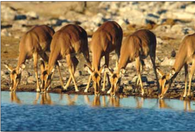
Impalas am Wasserloch