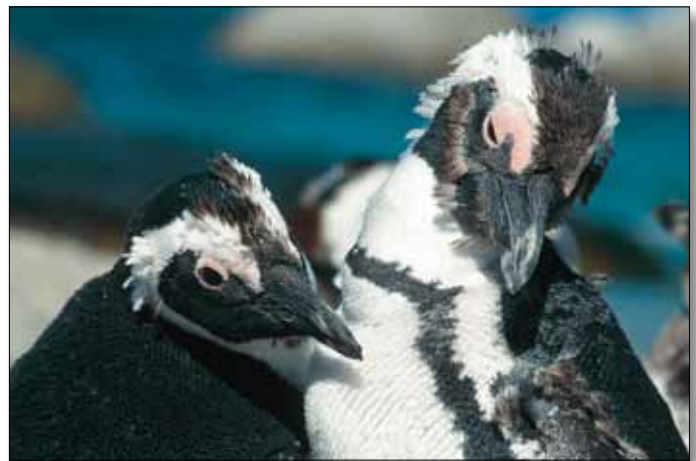
Brillenträger-Pinguine in Simonstown, Kaphalbinsel

5. Tag: Kapstadt - West Coast Nationalpark - Saldanha. Fahrt Richtung Norden in den West Coast Nationalpark, einem der besten Orte, um die großartige Schönheit der Westküste auf sich wirken zu lassen. Er ist eines der wenigen großen Naturschutzgebiete an der Küste Südafri- kas und wurde 1985 eingerichtet, um dieses einmalige Feuchtgebiet vor Umweltzerstörung zu bewahren. Auf dem Gelände lebten früher Khoikhoi und San, als 1497 hier Vasco da Gama in der St. Helena Bay landete.