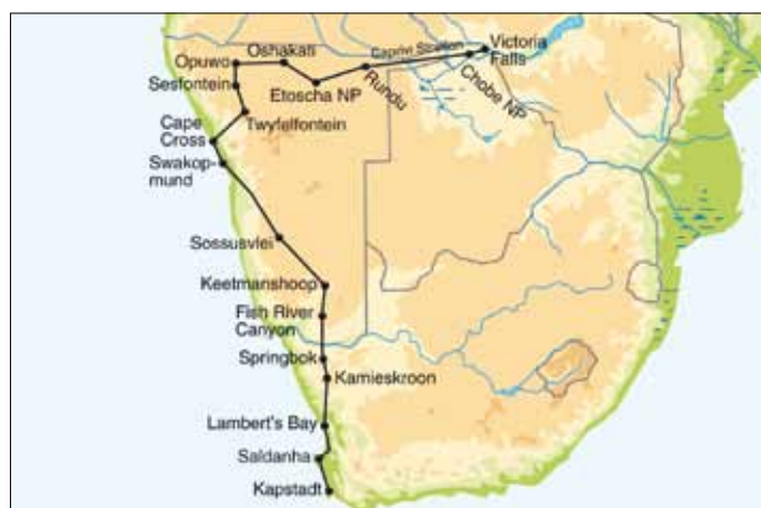
Reiseverlauf ‚Kapstadt/Südafrika - Namibia - Chobe NP/Botsuana - Viktoria Fälle/Simbabwe‘

9. Tag: Springbok - Fish River Canyon/Namibia. Weiterfahrt Richtung Norden zur namibischen Grenze und zum eindrucksvollen Fish River Canyon, dem größten Canyon Afrikas und einem der größten Na- turlwunder des Kontinents.