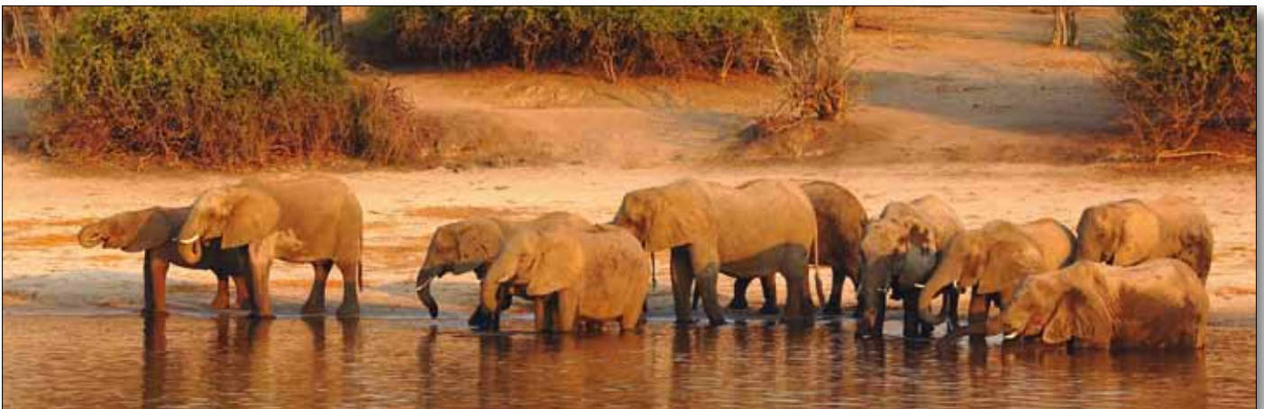
Chobe Nationalpark, Elefantenherde am Chobe River