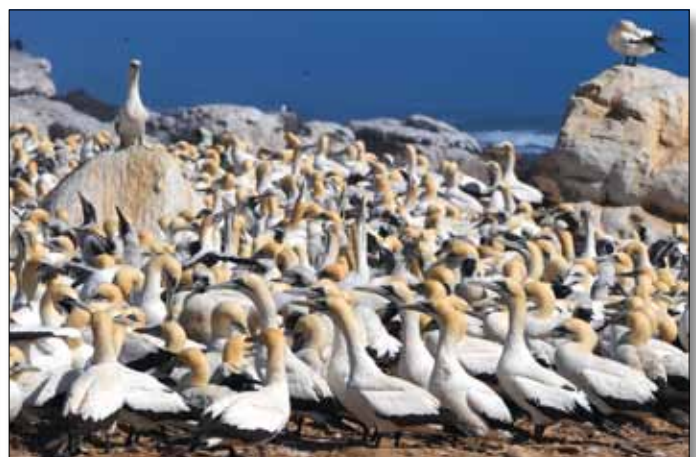
Kaptöpel auf Bird Island