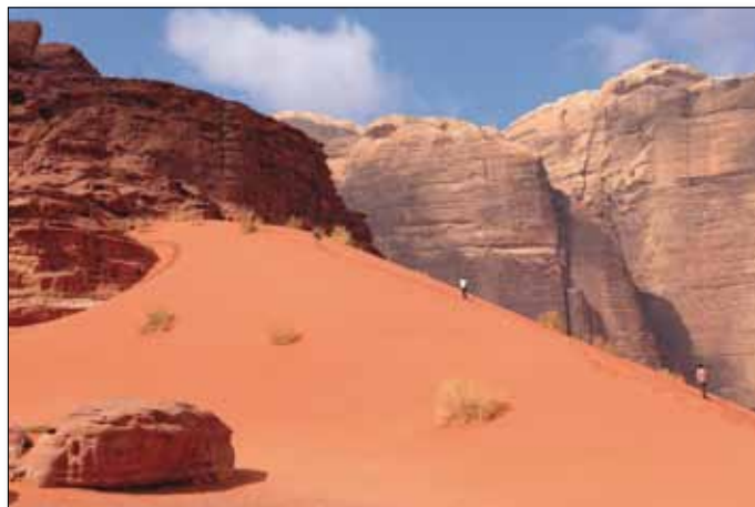
Wadi Rum - ocker leuchtende Sanddünen

8. Tag: Petra - al-Beidha - Siq el-Barid - Wadi Rum (UNESCO-Welterbe). Fahrt nach al-Beidha - Besichtigung der ca. 9000 Jahre alten Ruinen eines antiken Dorfes, das neben Jericho das älteste Siedlungsgebiet im Mittleren Osten darstellt. Weiter nach Siq el-Barid, auch Klein-Petra genannt, eine 'Geisterstadt' mit einer alten Karawanserei für den Handel mit Arabien - hier wurden früher die Karawanen der Nabatäer beladen. Anschließend geht es über den Desert Highway, vorbei am 'Berg der 7 Säulen', ins Wadi Rum. Am Nachmittag unternehmen wir eine Fahrt mit Geländewagen zur Quelle des 'Lawrence von Arabien', sehen die Felszeichnungen in der Schlucht Siq Ghasaleh und besuchen den kleinen Steinbogen. Übernachtung in Zelten in einem mobilen Camp