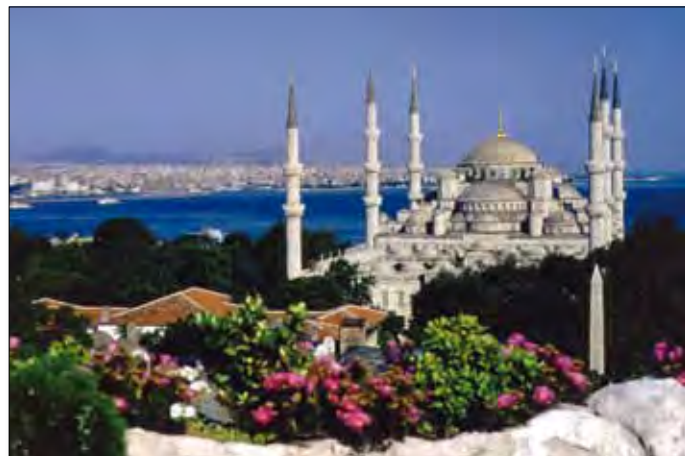
Istanbul, Blaue Moschee

* Flug ab/bis Linz nur beim 2. und 3. Termin möglich.