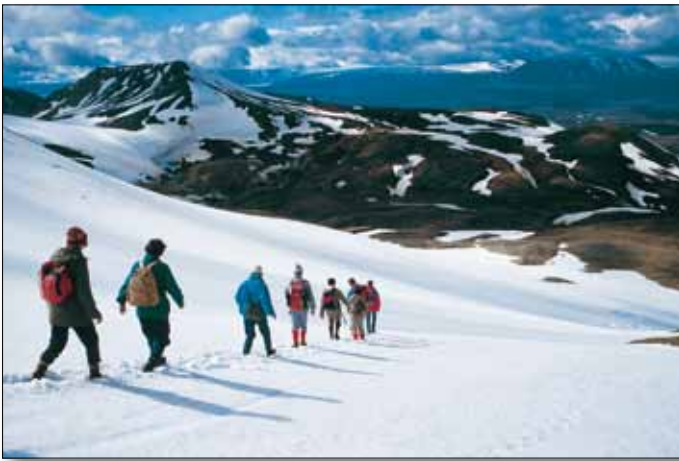
Wanderung in der Region Kerlingarfjöll