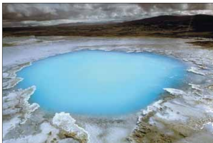
Thermalquellen in Hveravellir auf der Kjölur Hochlandroute

3. Tag: Reykjavík - Nationalpark Thingvellir - Thórsmörk. Fahrt in den Nationalpark Thingvellir (UNESCO-Welterbe), wo wir eine kurze Wanderung entlang der Altmännerschluft, der Almannagjá, zur alten Parlamentsstätte unternehmen. Hier wurde auf einem von Spalten und Schluchten durchzogenen Lavafeld im Jahr 930 das älteste noch bestehende Parlament der Erde gegründet. Über Selfoss erreichen wir die fruchtbaren Weideflächen Südislands und gelangen zum Tal der Markarfljót. Auf einer schwierigen Piste geht es in die Thórsmörk, einen birkenbestandenen Talkessel mit artenreicher Vegetation, der zwischen drei Gletschern eingebettet liegt - wegen seiner Schönheit wurde er einst dem Gott Thor geweiht. Oftmals werden Flüsse und Bäche mit dem Bus durchfuhrt, bis man schließlich die Hütte erreicht. Am Nachmittag ca. 2 - 3-stündige Wanderung in diesem herrlichen Gebiet. Möglichkeit zum Aufstieg auf den Aussichtsberg Valahnjúkur, von dem man einen grandio-