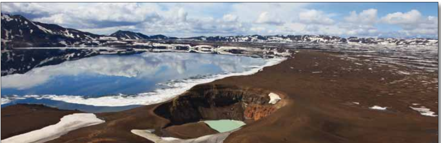
Caldera der Askja inmitten der Ódáðahraun, der größten Lawawüste der Erde