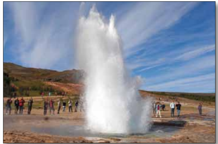
Geysir Strokkur im Haukadalur