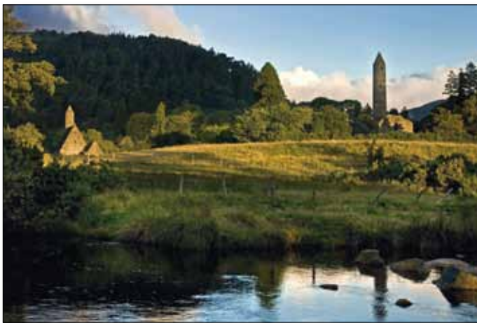
Glendalough inmitten der Wicklow Mountains