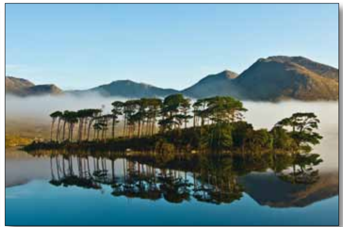
Connemara, am Fuße der Twelve Bens