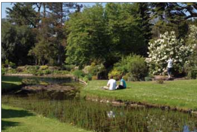
Dublin, Botanischer Garten