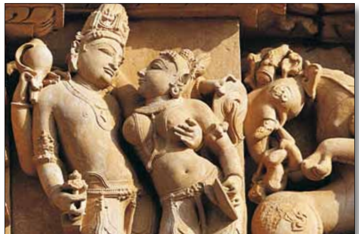
Khajuraho, Detail der Tempelreliefs