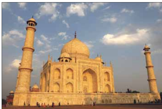
Delhi, Taj Mahal

4. Tag: Agra - Fatehpur Sikri - Karauli. Am Morgen Fahrt nach Fatehpur Sikri, die 'Stadt des Sieges' - die verlassene Residenzstadt des Mogulkaisers Akbar mit gewaltigen Palastanlagen, die einen fantastischen Eindruck einer Mogulstadt vermittelt. Die Stadt wurde im 16. Jh. von den besten Architekten ihrer Zeit angelegt, die Bauwerke prächtig aus rotem Sandstein gestaltet. Aufgrund von Wasserknappheit wurde Fatehpur Sikri nach nur 10 Jahren verlassen - die Gebäude aber nie zerstört. Zurück blieb eine grandiose Geisterstadt! Weiterfahrt nach Karauli,