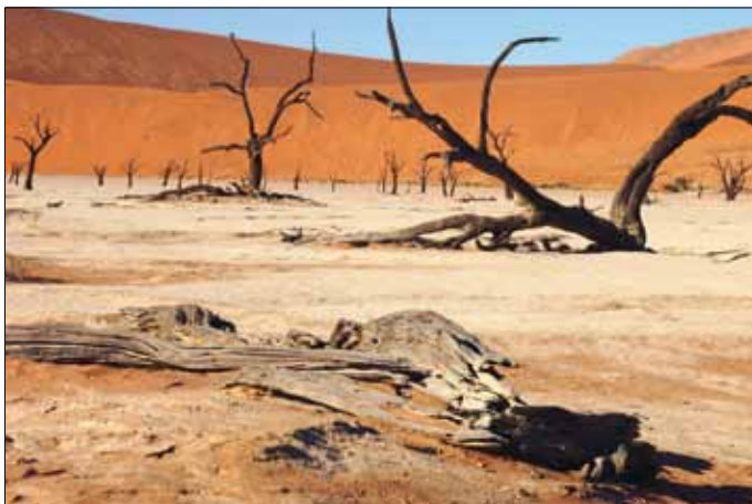
Dead Vlei im Namib Naukluft Park

10. Tag: Oshakati - Etoscha Nationalpark: Namutoni Lodge.