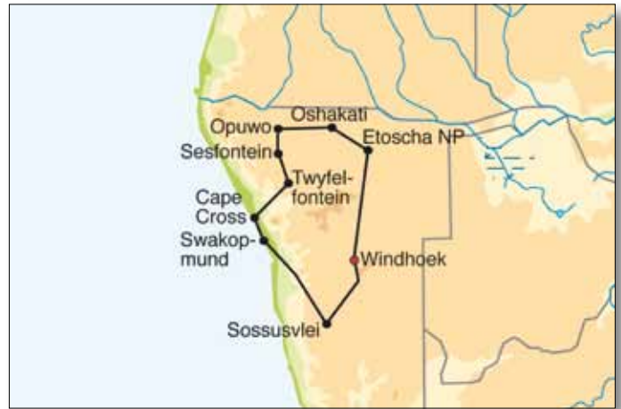
Reiseverlauf ‚Erlebnis Namibia‘

5. Tag: Namib Naukluft Park - Kuiseb Canyon - Welwitschia-Ebene - Swakopmund. Weiterfahrt durch die einzigartige Küstenwüstenlandschaft des Namib Naukluft Nationalparks - die Namib begleitet uns durch die bizarren Erosionslandschaften des Kuiseb Canyon bis zur eindrucksvollen Welwitschia-Ebene im Hinterland von Swakopmund. Die Welwitschias, prähistorische Pflanzen, wachsen am Rand einer Mond-