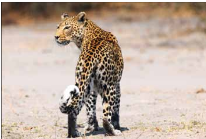
Leopard im Chobe Nationalpark