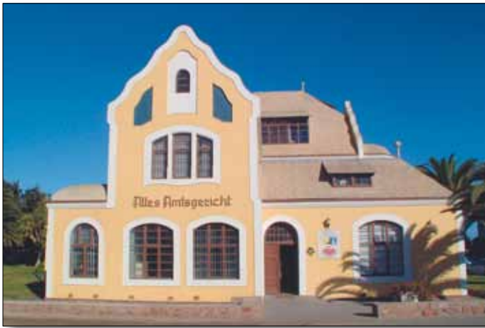
Deutsches Kolonialgebäude, Swakopmund