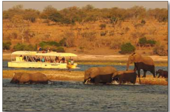
Ausflugsboot im Chobe Nationalpark