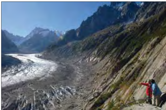
Mer de Glace (inkludierter Ausflug)

Reisepass oder gültiger Personalausweis erforderlich.