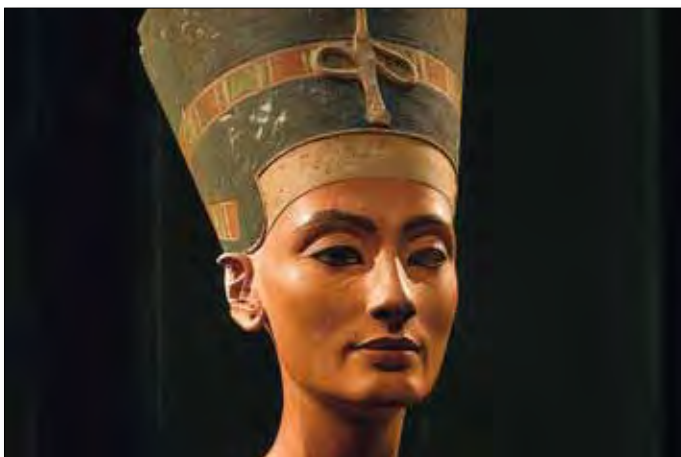
Nofretete-Statue im Neuen Museum, Museumsinsel Berlin