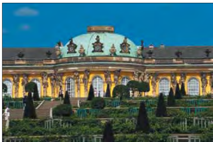
Potsdam, Schloss Sanssouci