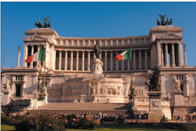
Nationalmonument Viktor Emanuels II

Bitte beachten Sie die abweichenden Stornobedingungen für Flüge mit Fly Niki/Air Berlin im Katalog auf Seite 3!