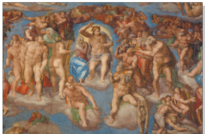
Rom, Sixtinische Kapelle - Jüngstes Gericht (Michelangelo)