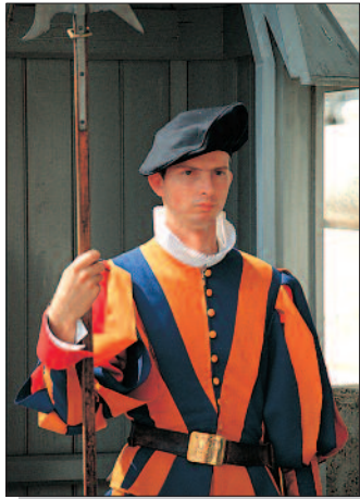
Schweizer Garde

1. Tag: Wels - Linz - Amstetten - Flug Wien - Rom: Santa Maria Maggiore - San Pietro in Vincoli - Antikes Rom. Transfer von Wels, Linz und Amstetten nach Wien. Beim 1. Termin: Abflug mit Air Berlin/Fly Niki von Wien um 6.05 Uhr nach Rom. Nach Ankomst um 7.35 Uhr Transfer zum Hotel. Beim 2. Termin: Abflug mit Austrian Airlines von Wien um 7.25 Uhr nach Rom. Nach Ankomst um 9.10 Uhr Transfer zum Hotel. Unser Stadtrundgang beginnt bei der mächtigen Basilika Sta. Maria Maggiore, der ältesten Marienkirche Roms, die neben einer prachtvollen Fassade auch ein großartiges Inneres mit fantastischen Apsismosaiken aufweist. Gleich gegenüber liegt versteckt die kleine Kirche Santa Prassede mit interessanten Mosaiken aus dem 9. Jh. Über den Esquilin-Hügel spazieren wir nach San Pietro in Vincoli, wo die angeblichen Ketten des Hl. Petrus aufbewahrt werden und die Statue des Moses, eines der berühmtesten Werke Michelangelos, bestaunt werden kann. Der Rundgang führt uns vorbei am Kolosseum zum Triumphbogen des Kaisers Konstantin und zum Forum Romanum, dem geistigen Zentrum des antiken Rom mit zahlreichen gut erhaltenen Bauten, sowie zum Kapitol, dessen Treppe und der Kapitolplatz ein architektonisches Meisterwerk von Michelangelo darstellen. Hier liegt auch die Piazza Venezia, die vom mächtigen Nationalmonument Viktor Emanuels II. beherrscht wird, und wo die Trajans-Säule, zum Sieg des Kaisers über die Daker, aufgestellt ist.