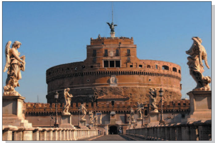
Rom, Engelsburg und Engelsbrücke

4. Tag: St. Paul vor den Mauern - Flug Rom - Wien. Am Vormittag Fahrt zur Basilika 'Sankt Paul vor den Mauern', die über dem Grab des Apostels Paulus