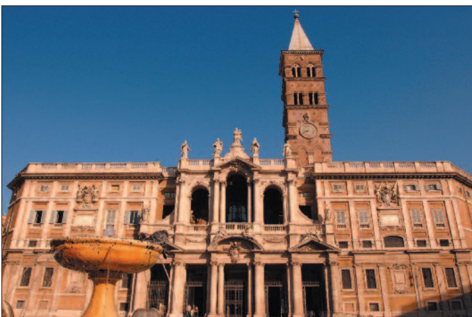
Basilika Santa Maria Maggiore