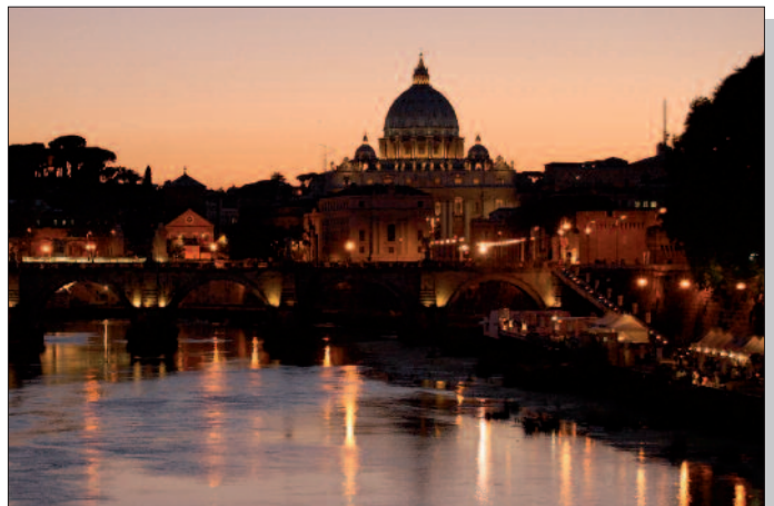
Rom, Blick über den Tiber