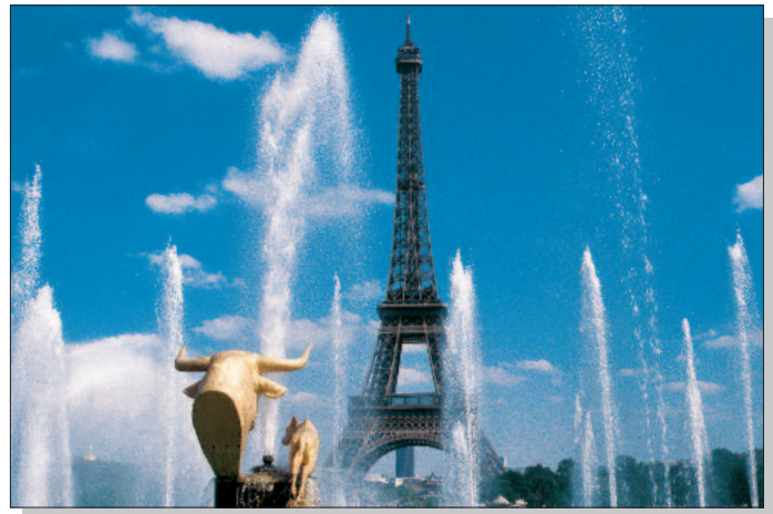
Paris, Eiffelturm - vom Trocadero aus gesehen

4. Tag: Paris: Triumphbogen - Champs-Élysées - Louvre - 'Paradis à la folie'. Fahrt zum Triumphbogen, einem der Wahrzeichen der Metropole, und Spaziergang auf den Champs-Élysées (Zeit zur freien Verfügung) zum Place de la Concorde - dem größten Platz von Paris - mit dem markanten Obelisk vom Luxor- Tempel in der Platzmitte. Anschließend Besuch des Louvre, des größten Museums der Welt, wo Sie neben dem Portrait der 'Mona Lisa' von Leonardo da Vinci viele weitere Werke bekannter Künstler aus den verschiedensten Epochen bestaunen können. Herausragend sind die griechische und römische Antikensammlung und die italienische Renaissanceemalerei. Am Abend Möglichkeit zum Besuch der Re-