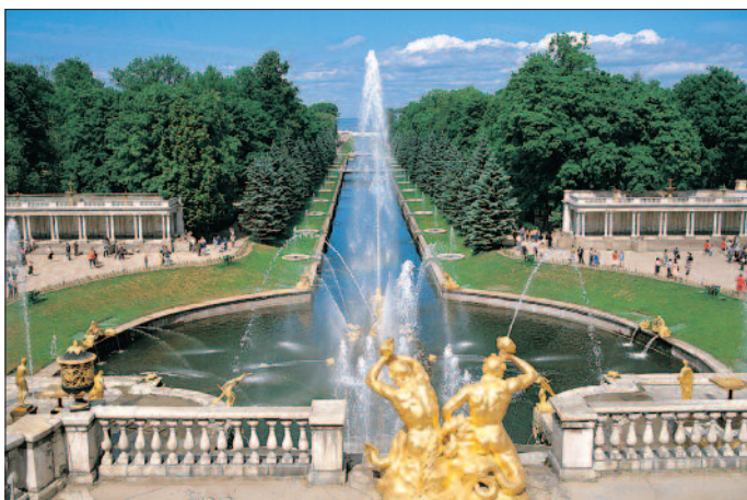
St. Petersburg, Peterhof, Gartenanlage

Gültiger Reisepass mit russischem Visum erforderlich.