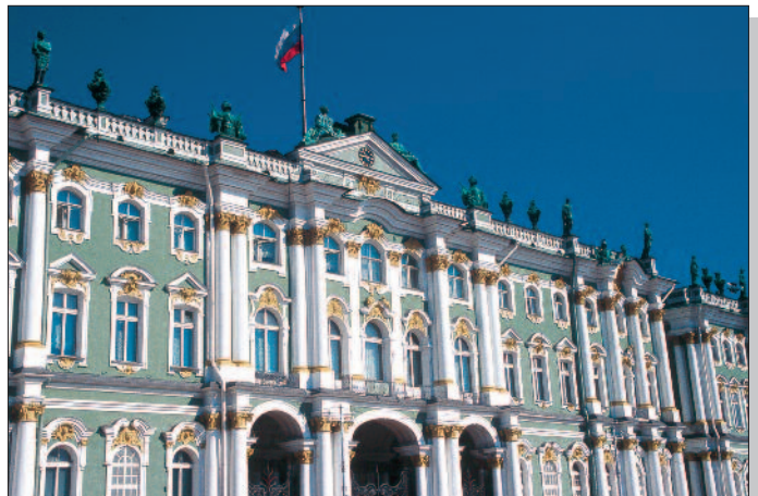
St. Petersburg, Eremitage

Gültiger Reisepass mit russischem Visum erforderlich.