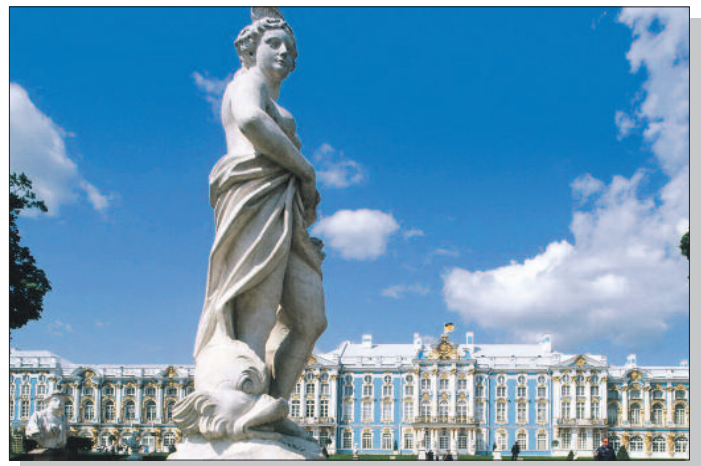
St. Petersburg, Katharinenpalast