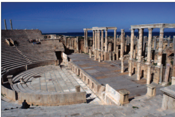
Theater von Leptis Magna

3. Tag: Apollonia - Cyrene - Latrun - Ras el-Hilal - Apollonia. Ausflug nach Cyrene, das steil auf einem Berghang mit herrlichem Blick auf das Mittelmeer errichtet wurde. Cyrene wurde als erste griechische Kolonie in Afrika bereits 631 v. Chr. gegründet und war später eine wichtige hellenistische Stadt, deren Bauwerke den Ruhm vergangener Zeiten widerspiegeln: Zeus-Tempel, Theater, Apollo-Quelle und Gymnasium sind nur einige der sehenswerten erhaltenen Gebäude. Spaziergang über den alten Prozessionsweg hinunter zum Theater. Zum Abschluss sehen wir die spätantiken Kirchen von Latrun und Ras el-Hilal: Latruns kürzlich