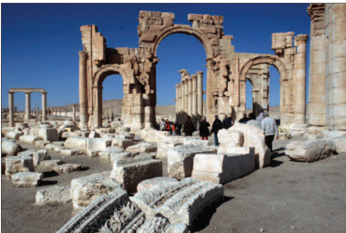
Stadttor von Palmyra

*) Programmverlauf zuerst Syrien, dann Jordanien.