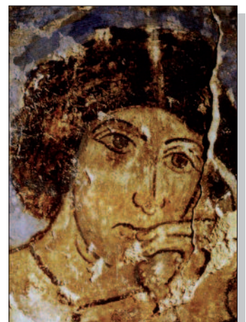
Fresko, Qasr Amra