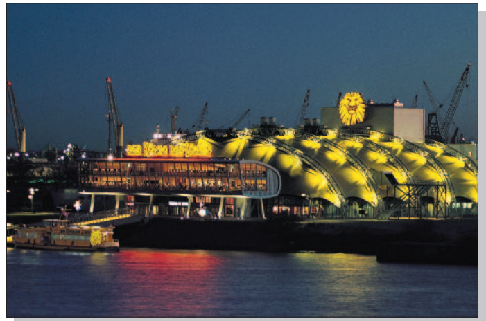
'Theater im Hafen'