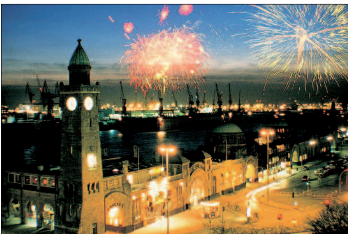
Feuerwerk am Hafen von Hamburg