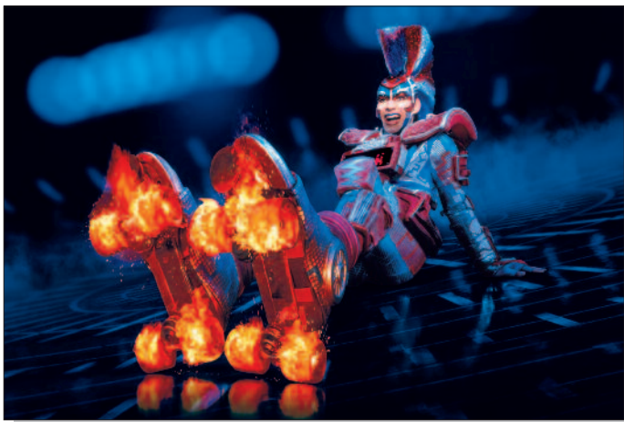
Electra, 'Starlight Express'