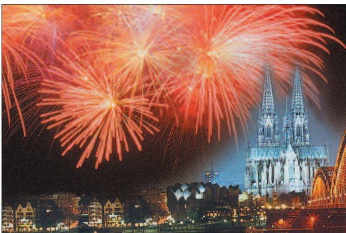
Feuerwerk über dem Rhein-Ufer

Aufpreis 4. Kat.: € 11,- Aufpreis 3. Kat.: € 21,- Aufpreis 2. Kat.: € 32,-