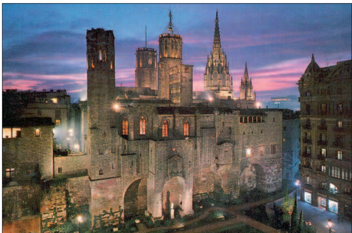
Barcelona, Blick auf Königspalast, Kathedrale und Barrio Gotico