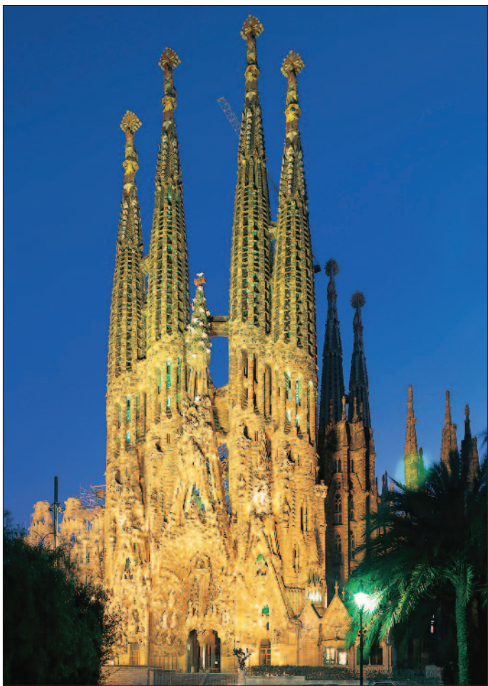
Barcelona, Sagrada Familia