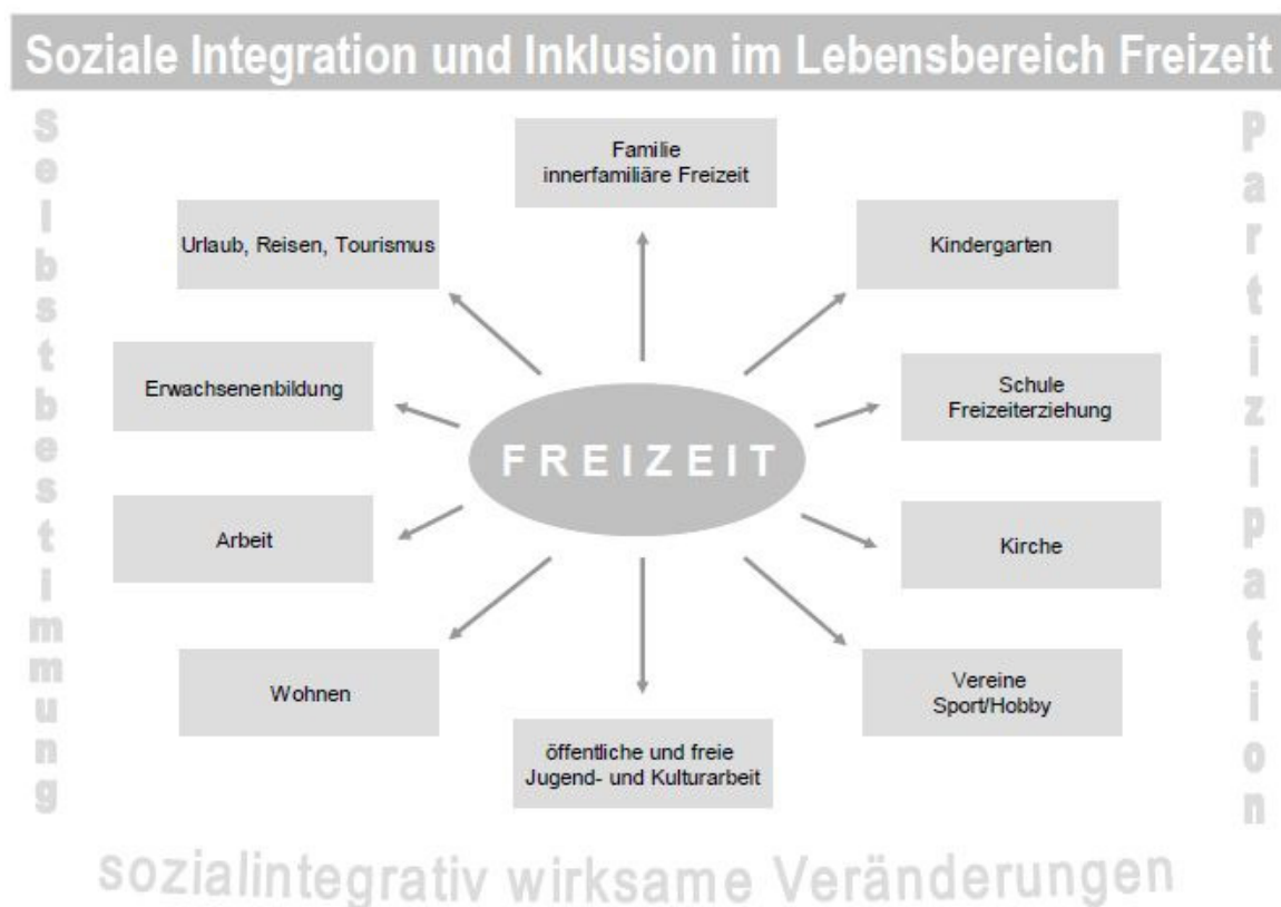
Abb. 2: Selbstbestimmung und Teilhabe im Lebensbereich Freizeit bedingen sozialintegrativ wirksame Veränderungen in allen Facetten des Freizeiterlebens und Freizeitgestaltungsmöglichkeiten

Auf dem Weg zu einer inklusiven Gesellschaft bedarf es folgerichtig einem deutlichen Mehr an Beachtung, Aufwertung sowie der Professionalisierung der Freizeit. Mit Blick auf das disperse Feld des integrationspädagogischen Arbeitens in den sehr unterschiedlichen Freizeitbereichen und Freizeiteinrichtungen wie auf das pädagogische Erleben in offene, nicht institutionalisierte Freizeitsituationen (vgl. Abb. 2; Markowetz 2000a, e; 2007b) wird in diesem Beitrag die Notwendigkeit der flächendeckende Einführung von Freizeitassistenz als überdauernde und alle Handlungs- und Erfahrungsfelder von Freizeit gleichermaßen bestimmende Wirkvariable thematisiert und als Schlüssel für sozialintegrativ wirksame Veränderungen diskutiert.